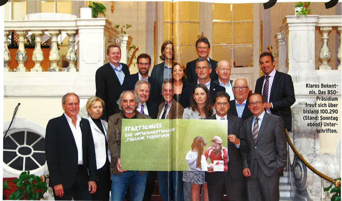
Klares Bekenntnis. Das BSO-Präsidium freut sich über bislang 100.290 (Stand: Sonntag abend) Unterschriften.